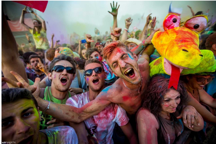
Hatalmas dili (#NOT)

És ezek között ott van ez color party névre keresztelt agyrém, ami arról szól, hogy színes port dobálnak az emberek egymás arcába, meg mindenhova, hogy aztán egész este tök mocskosan mászkáljanak a fesztiválon, és amikor benyomulnak a zsúfolt koncertekre, azoknak is levakarhatatlanul lila meg sárga legyen a fekete dzsekije, akiknek ez egyáltalán nem állt szándékában.