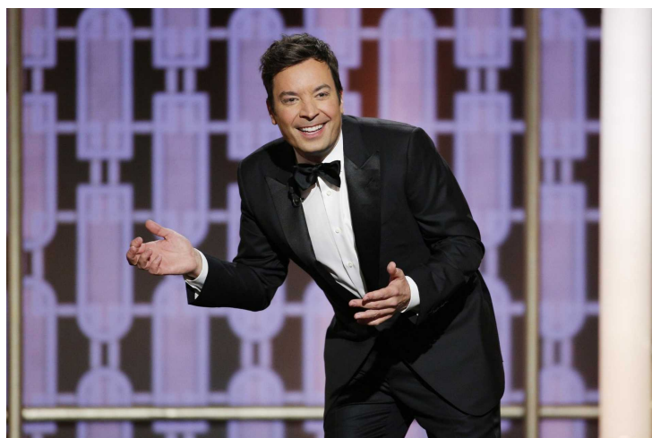
Jimmy Fallon kicsit odamondogatott

A gálán volt egy kis politikai odamondogatás is. A még mindig az elnöki beiktatását váró Doland Trump kapott egy kis savazást. Fallon azt hangsúlyozta, hogy a Golden Globe-díjátadó azon kevés helyek egyike, ahol a szavazattöbbség még számít. A komikus ezzel arra utalt, hogy Trump annak ellenére lett az USA elnöke, hogy kevesebb szavazatot kapott, mint ellenfele Hillary Clinton, csupán az elektori rendszer miatt lehetett ő a befutó.