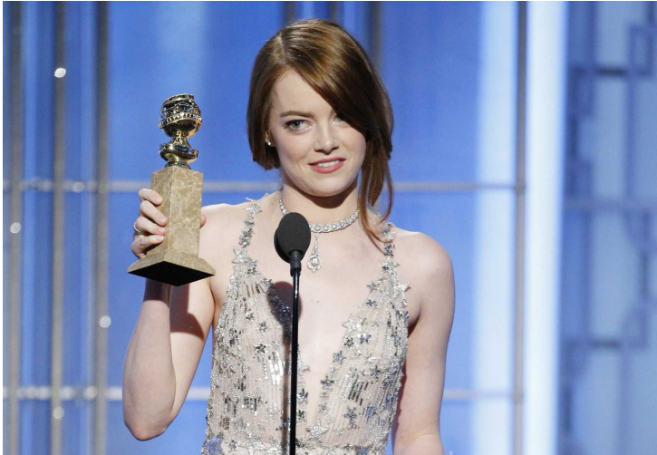
Emma Stone, aki a legcukibb színésznő díjára is eséllyel pályázhatott volna

Damien Chazelle felidézte, hogy hat évig dolgozott alkotótársaival a zenés film forgatókönyvén, mielőtt lehetőséget kapott volna arra, hogy leforgassa a produkciót.