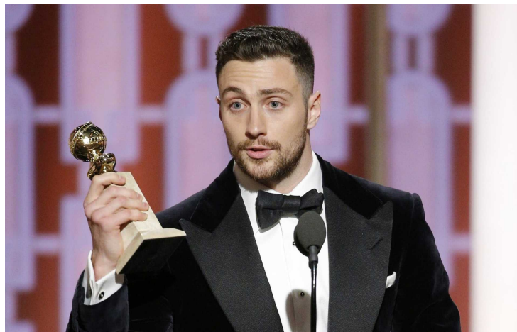
Egy friss díjazott, a legjobb férfi mellékszereplő kategória győztese Aaron Taylor-Johnson

A filmdrámák kategóriájában a tudósítótétel az Elle című thriller francia sztárjának, Isabelle Huppert-nek és A régi város főszerepét alakító Casey Afflecknek ítélte oda a díjat. Casey Affleck élete eddigi talán legjobb alakítását nyújtotta Kenneth Lonergan filmjében. A meghatottság és az izgalom miatt a szavakat is alig találó Huppert a film alkotóinak, elsősorban Paul Verhoeven rendezőnek mondott köszönetet. Affleck kolléganőjét, a szintén Golden Globe-díjra jelölt Michelle Williamst is üdvözölte a színpadról, aki szerinte a forgatáson "a munka javát végezte".