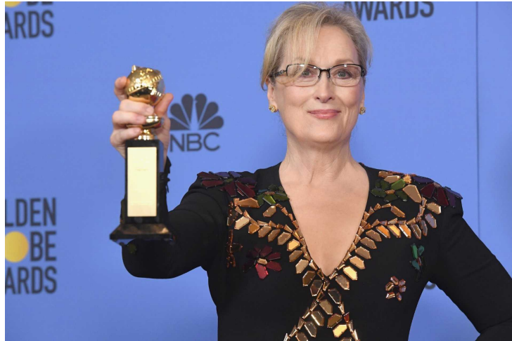
Meryl Streep is díjat vehetett át

gyűlésen gúnyt űzött egy fogyatékossgal élő újságíróból. A színésznő Hollywood sztárjaihoz fordulva arra kérte őket, hogy ünnepeljék és védjék meg a másságot. Hollywoodban hemzsegnek a kívülállók és a külföldiek, és ha kirúgjuk őket, nem lesz mit nézni a futballon és a vegyes harcművészeteken kívül, az pedig nem művészet - fűzte hozzá. A színésznő, akit állva tapsolt meg a közönség, alig tudott beszélni hangszálggyulladása miatt, de hangja a rátörő érzelmektől is többször is elcsuklott.