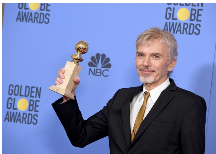
Egy nem talpó télapó

A televíziós kategóriákban az Atlanta és a The Crown című sorozat, valamint az American Crime Story - Az O.J.Simpson ügy című minisorozat kapta a díjakat. A Los Angeles-i gála első díjazottjai között volt még Billy Bob Thornton, aki annak ellenére tudott kimagaslót is nyújtani, hogy a Tapló télapó 2-vel eléggé nagyot taszajtott lefelé a karrierjén. A Goliath drámasorozat férfi főszereplője és Tracee Ellis Ross, a Feketék fehéren című vígjátéksorozat női főszereplője kapta a legjobb tévés színészi alakítás női és férfi díjait.