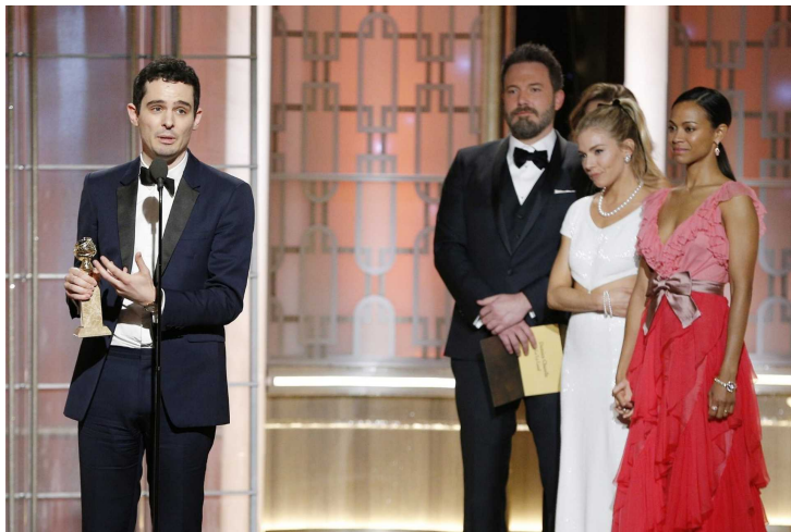
Damien Chazelle itt épp átvette a díját

Magyar idő szerint hétfő hajnalban rendezték meg a 74. Golden Globe-díjátadót Los Angelesben, amit nem mellékesen az Oscar előszobájaként szoktak emlegetni. A gálát Jimmy Fallon komikus vezette, és mivel Damien Chazelle filmje, a Kaliforniai álom hét jelölést is kapott és sejthető volt, hogy a favoritnak számító alkotás jó néhányat be is vált, így a műsorban már előre tervezve jó pár musical paródia is helyet kapott.